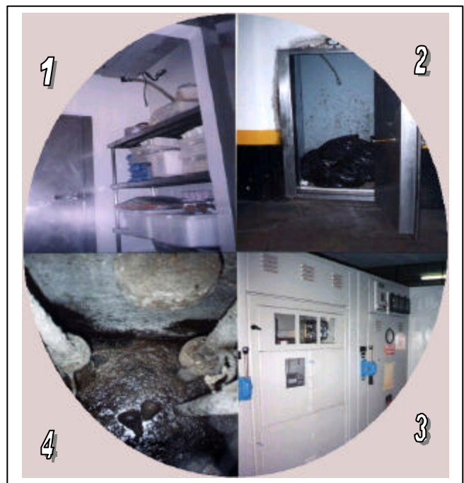
ÁREAS DE DESPERDÍCIO

Com Graduação em Administração de Empresas. Experiência em docência. E-mail: dollyrt@ig.com.br